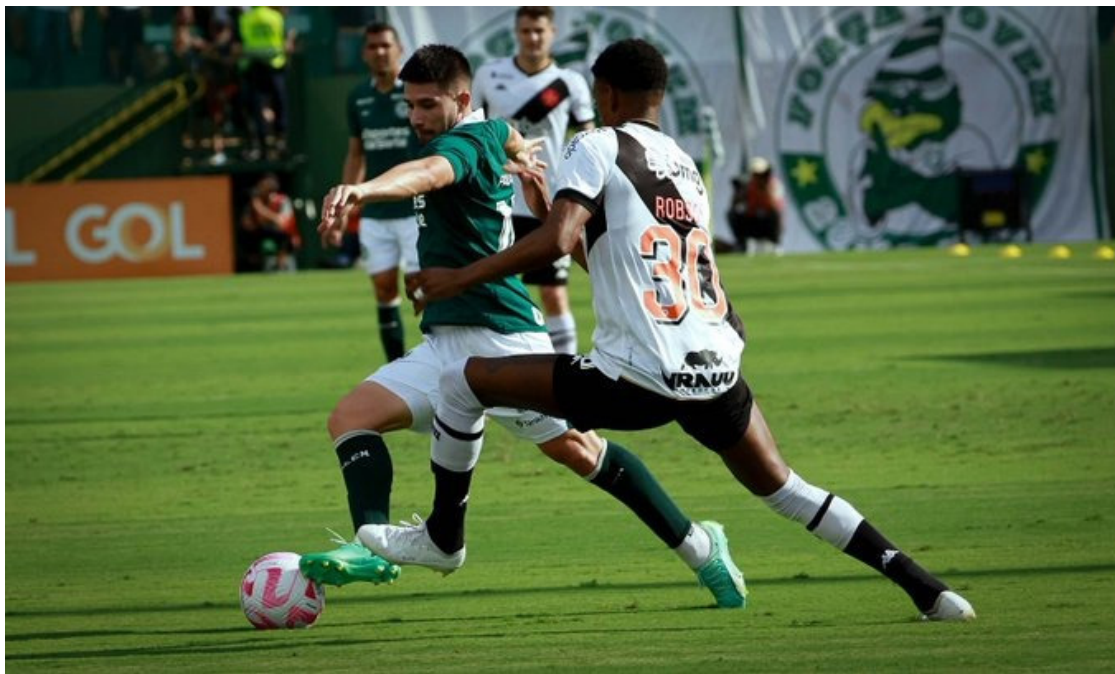
Goiás faz gol nos acréscimos do segundo tempo e se livra de uma situação ainda pior na tabela

para os dois times. O Goiás tentava dar a volta por cima depois da derrota para o Fluminense. O time chegou a abrir 2 a 0 logo no início do jogo, mas levou a virada e perdeu por 5 a 3.