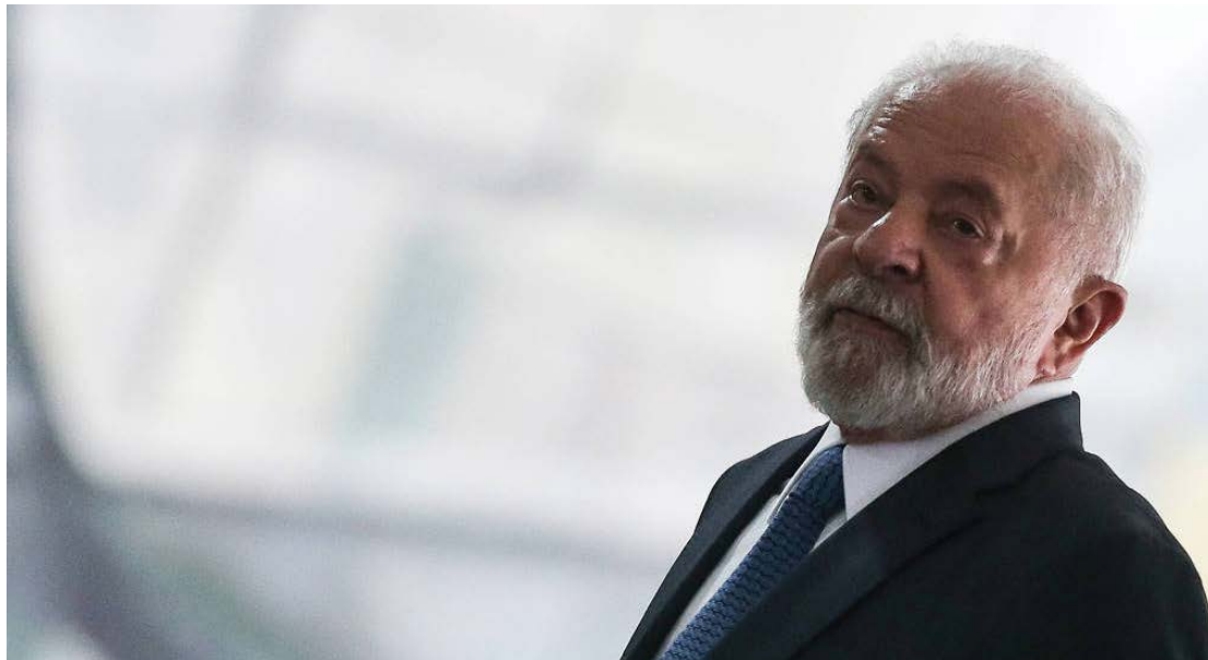
Lula da Silva: não há decisão sobre o novo Ministério da Segurança Pública

Lula foi munido com novas pesquisas que indicam que os problemas enfrentados por estados, alguns governados por correligionários, acabam respingando na gestão federal. Por essa razão, o tema ficou nos últimos dias entre as prioridades do presidente, que dará aval a um plano mais amplo de ajuda