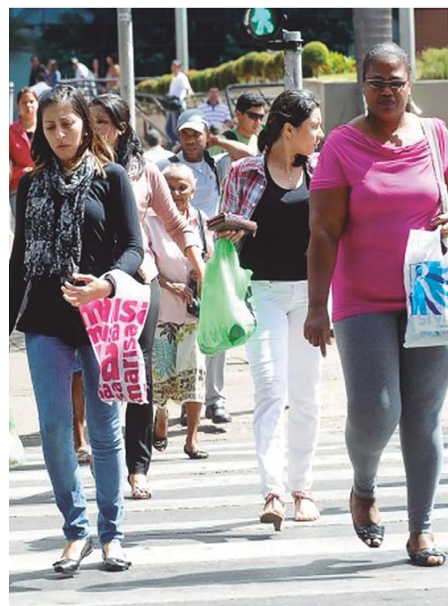
Proporção da população feminina cresceu em comparação com 2010 e reforça tendência nacional e estadual

“A sociedade sempre é composta por diferentes segmentos da população e as demandas são pautadas pela idade que nós temos, uma criança pequena demanda creche, depois escola, ensino superior, emprego, construção de residências... O peso de cada seguimento vai mudando com o tempo e é isso que vai nortear muito as preocupações que o poder público deve ter”, destacou o especialista.