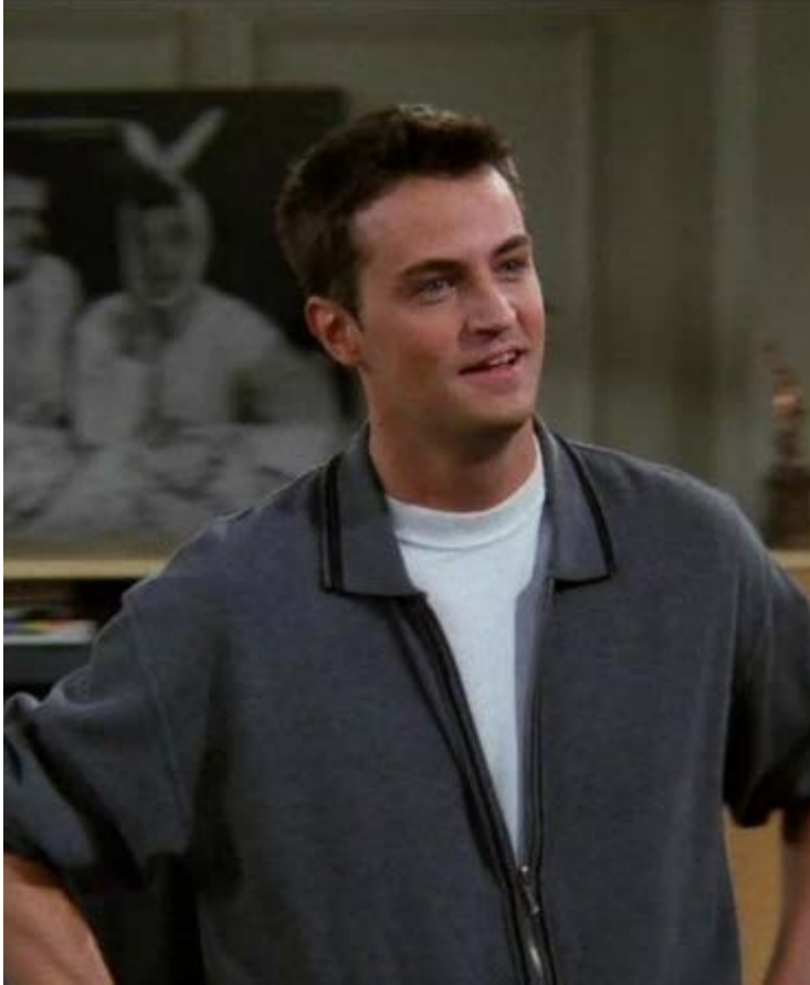
Chandler Bing: personagem moldou geração com humor sarcástico e ferino