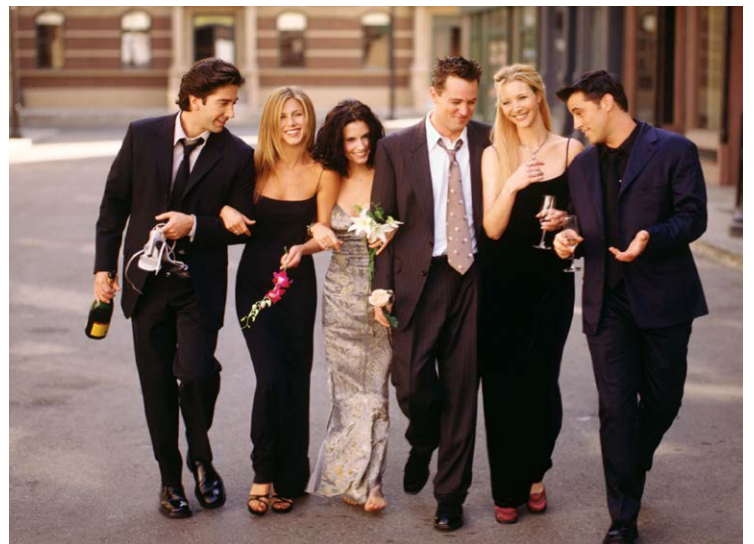
Elenco de 'Friends': atores ajudaram a moldar comportamento de uma geração

No livro, Perry confessa ainda que a nona temporada da série foi a única temporada de "Friends" em que ele estava totalmente sóbrio, e a única que o rendeu indicação ao Emmy. Segundo o ator, ele achava que conseguia manter seu vício em segredo até que, um dia, Aniston disse que elenco e equipe percebiam o cheiro de álcool nele.