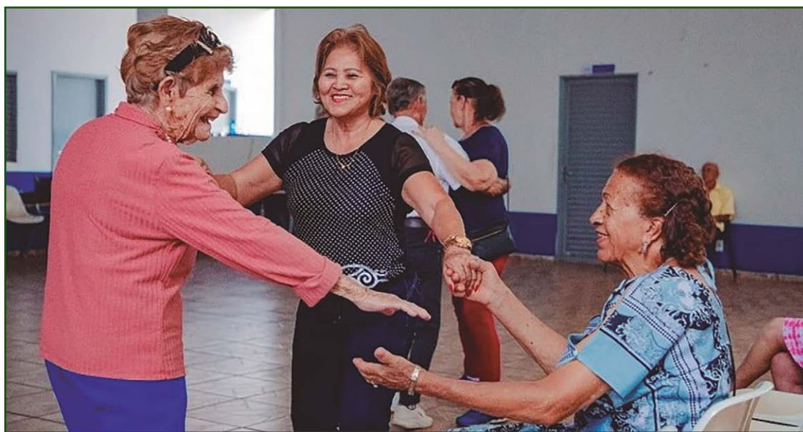
A média de idade, que, há 12 anos, ficava abaixo dos 30 anos, aumentou muito e, agora, chegou aos 33 anos