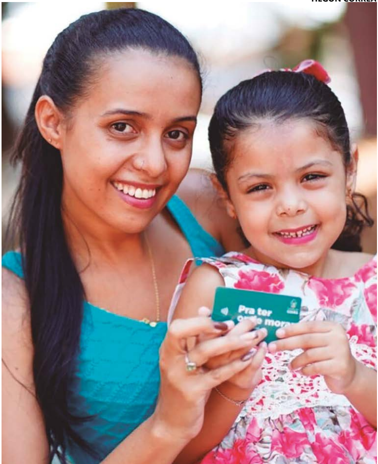
Cadastro está aberto por tempo indeterminado, no site da autarquia