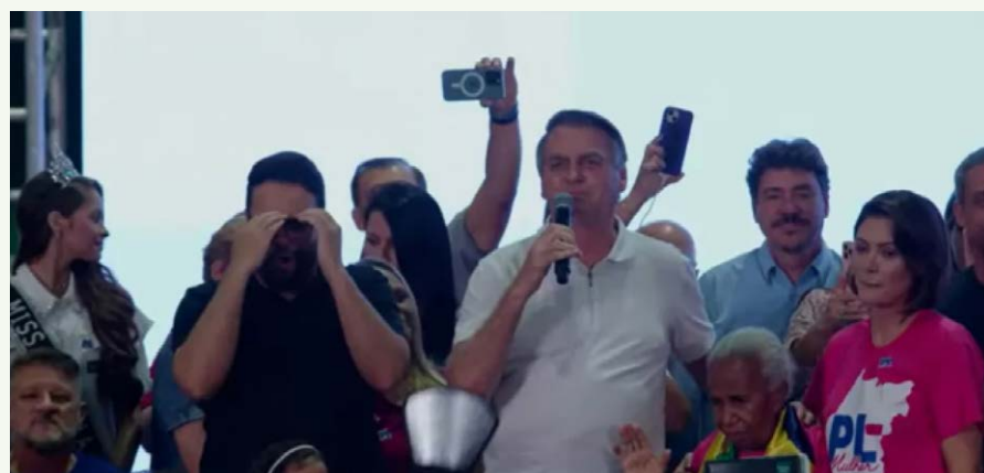
Jair e Michelle Bolsonaro: estímulos à participação das mulheres na política

PL Mulher, Jair Bolsonaro estimulou as mulheres a entrarem para a vida pública e concorrer a cargos públicos. Ele quer presença forte das mulheres na chapa do partido para a disputa de prefeito e vereador em Goiás. Ex-primeira dama Michelle Bolsonaro foi a estrela do encontro do PL Mulher.