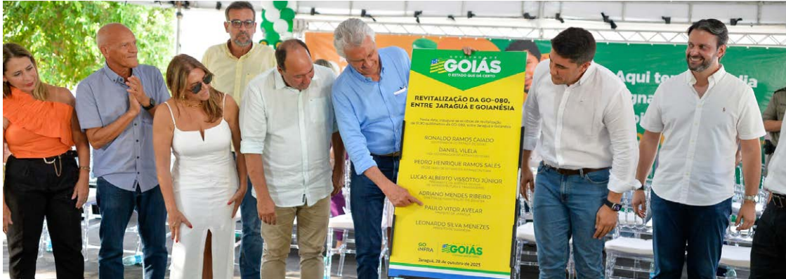
Governador Ronaldo Caiado durante entrega de benefícios do Goiás Social, em Jaraguá

“Hoje é um dia de festa e agradecimento pelos benefícios entregues”, reconheceu o prefeito de Jaraguá, Paulo Vitor. “Com esses cartões, são mais R$ 300 mil por mês circulando no comércio da cidade”, avaliou, destacando o impacto econômico e social posi-