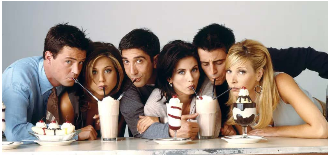
Estouro da cultura pop: "Friends" era algo como os Beatles da comédia romântica