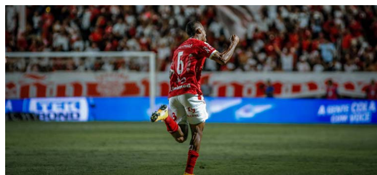
Vila faz gol nos acréscimos e vence Atlético-GO de virada no OBA

Na próxima rodada, o Vila enfrenta o Vitória (BA) no domingo, 5, fora de casa. Já o Dragão pega o Novorizontino (SP) na quarta-feira, 1, no Estádio Antônio Accioly. Os dois jogos são confrontos diretos em busca do acesso à Série A do Brasileiro.