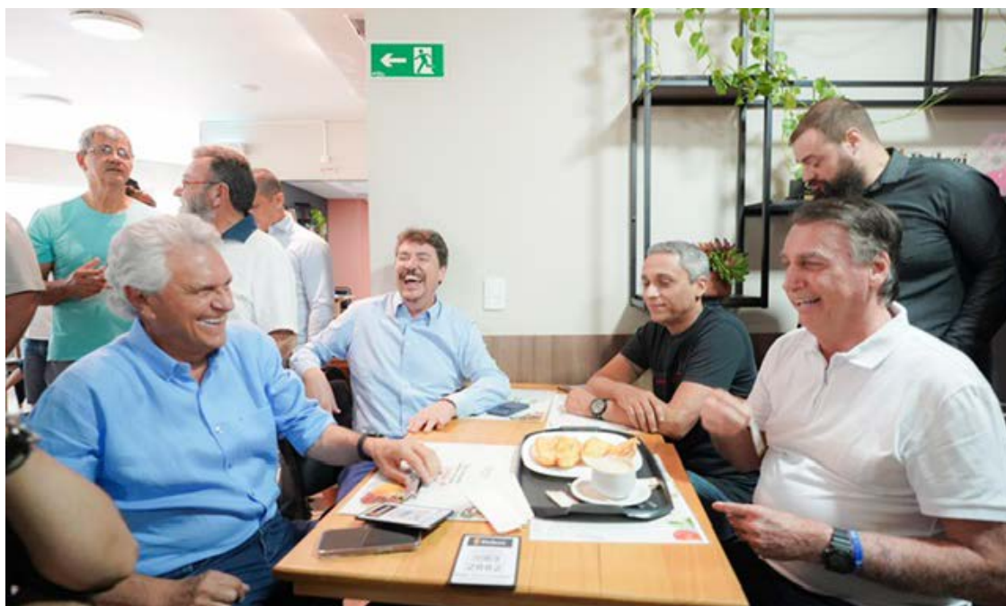
Jair Bolsonaro e Ronaldo Caiado: início de diálogo para alianças em Goiás visando eleições

Bolsonaro foi declarado inelegível pelo Tribunal Superior Eleitoral (TSE) para 2026 e o governador de Goiás, Ronaldo Caiado coloca seu nome como alternativa do espectro da direita, que tem, também,