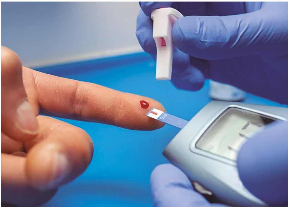
Diabetes mellitus é doença crônica, causada pela deficiência do hormônio insulina ou pela resistência à sua ação