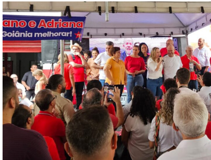
Adriana Accorsi: terceira disputa à prefeitura de Goiânia

Deputada federal inicia terceira corrida ao Paço Municipal com apoio do presidente Lula da Silva: nome será oficializado na convenção partidária que vai ocorrer em julho do ano que vem