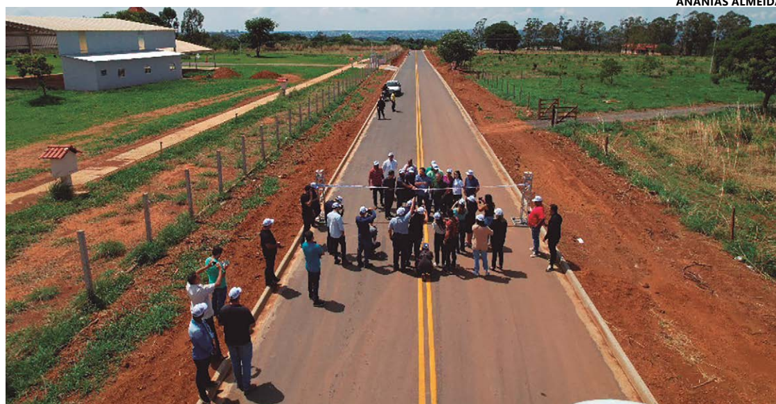
Entrega da pavimentação do anel viário que liga Miranópolis ao bairro Dom Felipe, com extensão de 4,5 km