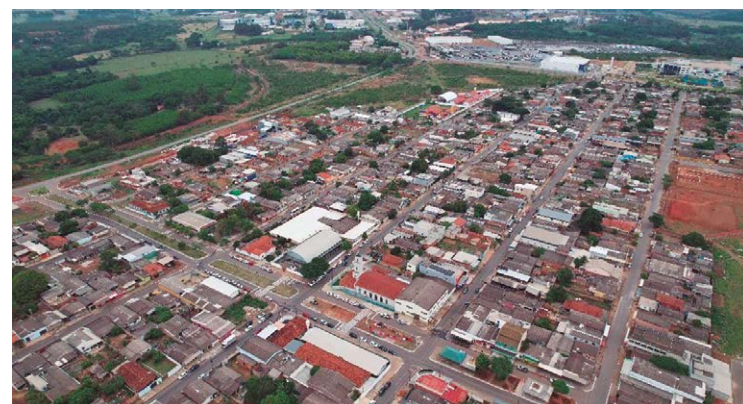
12 km de asfalto no Setor Industrial Munir Calixto e iluminação de LED