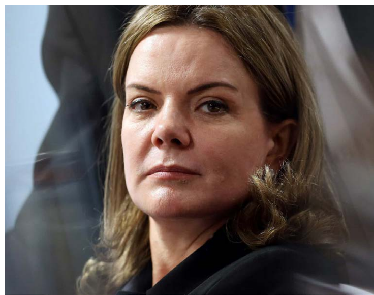
Gleisi Hoffmann: Lula está afinado com o ministro Fernando Haddad

A presidente do PT elogiou o ministro da Fazenda, mas afirmou que não “depende dele” o cumprimento da meta fiscal. Ela aproveitou para criticar abertamente Campos Neto, com quem o governo tem divergências. “Infelizmente nem tudo depende dele [de Haddad] e da equipe econômica, como o crescimento da receita, por exemplo. Entram aqui Congresso Nacional, decisões judiciais, postergações administrativas. Também entra outro grande obstáculo, que é a criminosos taxa de juros mantida nas alturas pelo BC de Campos Neto”, escreveu ela.