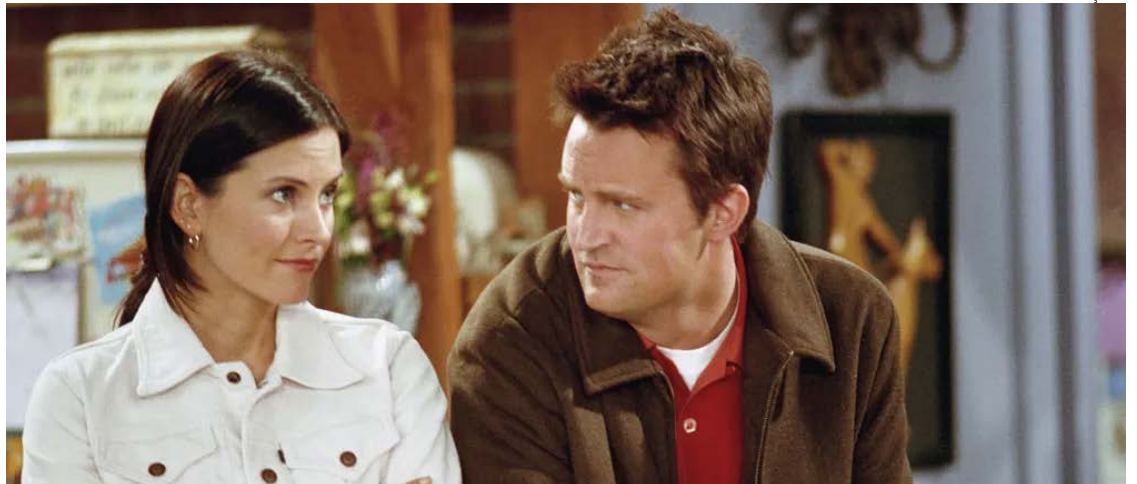
Courteney Cox e Matthew Perry: atores viveram um casal durante seriado